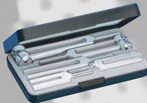
Nr. 5142 Набор III 5 камертонов, изготовленных из алюминия (Nr. 5162, Nr. 5165, Nr. 5167, 5169, Nr. 5171) в пластиковом футляре.

Дистрибьютор фирмы "Rudolf Riester GmbH & Co.KG"